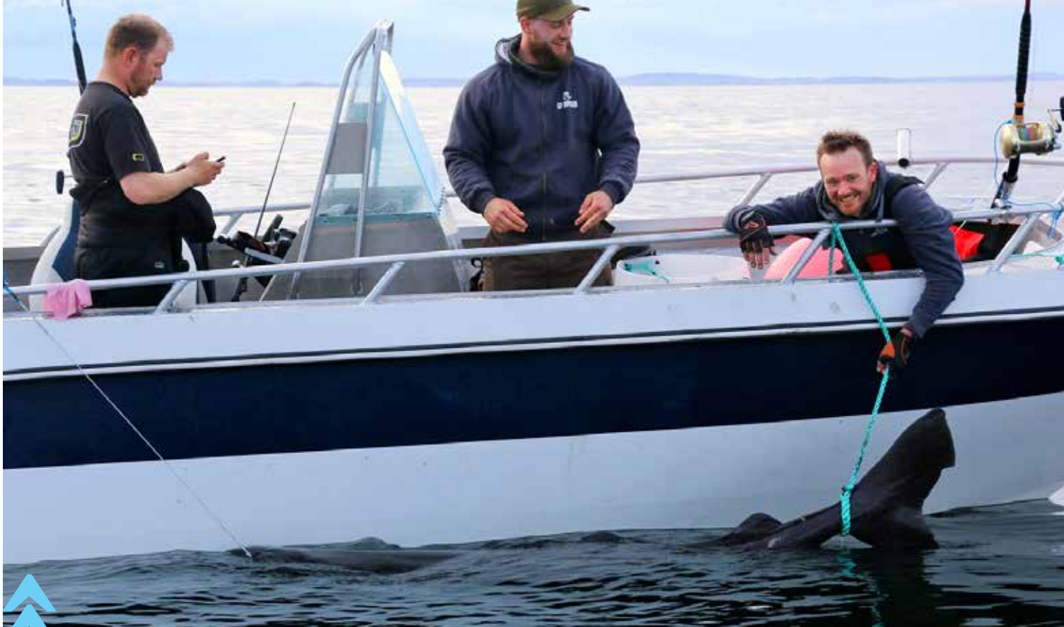
Håkjerring: Denne fisken tok vi både vevs- og parasittprøver fra, som blir levert til forskere.

tregt fiske, men helt på tampen av dagen dro Ojan til med en skikkelig flott spisskate på 12,1 kg, som var en ny art for han. Etter at han hadde fått spisskaten, avsluttet vi og gjorde oss klare til en lang økt dagen etter. Værmeldingene hadde nemlig gitt oss et vindu hvor det nesten ikke skulle blåse.